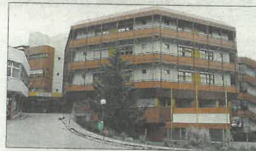
Zwei Corona-Patienten lagen am Montag im Landesklinikum Lilienfeld auf der Intensivstation.

befanden sich 181 Personen. Eine Woche zuvor standen vergleichsweise 33 positive Corona-Fälle zu Buche – bei über 100 Bürgern in Isolation.