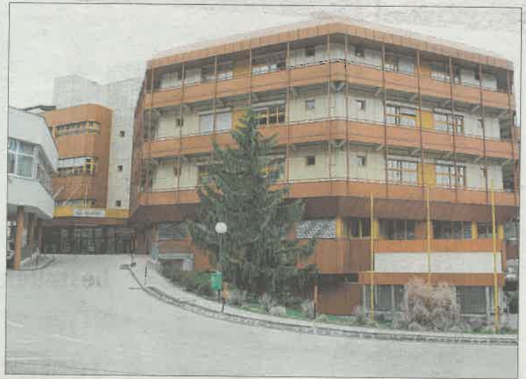
Im Landeskrankenhaus Lilienfeld wurden zu Redaktionsschluss zwölf Corona-Patienten stationär behandelt.